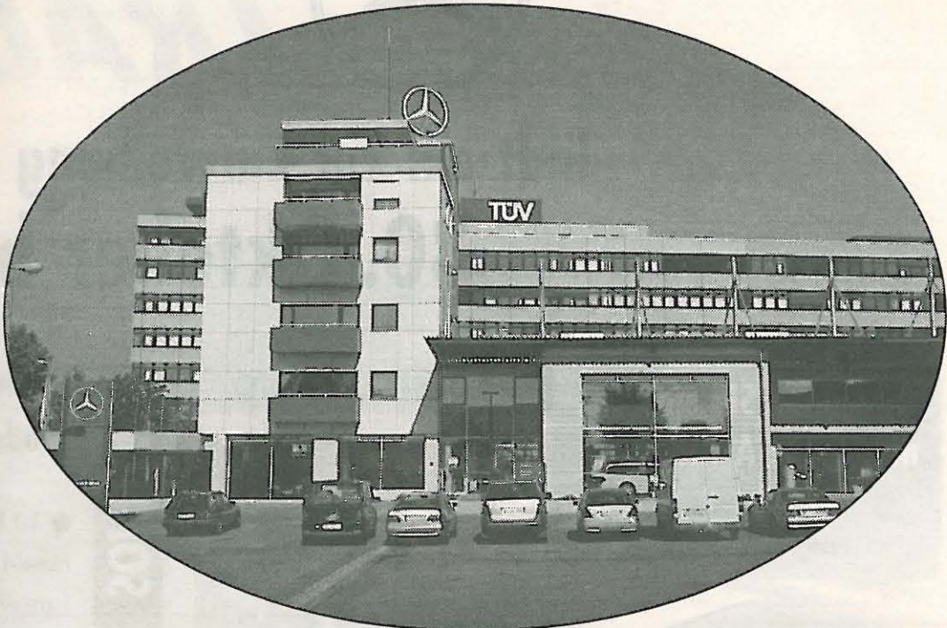
Architektonisch ansprechend wurde das Kundencenter zwischen Ausstellungsräumen und Werkstatt eingepasst

In den Neubau integriert ist ein modern ausgestatteter Direktannahmebereich mit Bremsen- und Stoßdämpferprüfstand sowie einer Spurprüfstraße für die ankommenden Fahrzeuge. Nach Passage der einzelnen Checks wird elektronisch das Protokoll ausgedruckt. So kann schnell geklärt werden, wo ein Defekt vorliegt und welche Reparaturen zu dessen Behebung nötig sind.