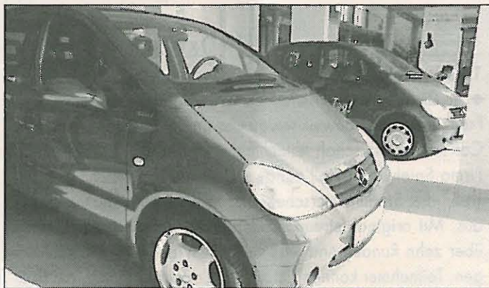
Die Ausstellungsräume wurden modernisiert und vergrößert

station, Kraftstoffhandel sowie Reparatur von Fahrrädern, Pkw, Lkw und Landmaschinen. 1957 wurde der Vertrag mit der damaligen Daimler-Benz AG abgeschlossen. Unter den Söhnen Hans und Hermann wurde 1972 im Gewerbegebiet Käferloch gebaut. Eines dieser alten Gebäude mußte jetzt abgerissen werden. 1979 wurde die Firma mit etwa 15 Beschäftigten in Autohaus Trautwein GmbH umgewandelt. Nach mehreren kleineren An- und Neubauten wie Ausstellungsraum oder Lackieranlage