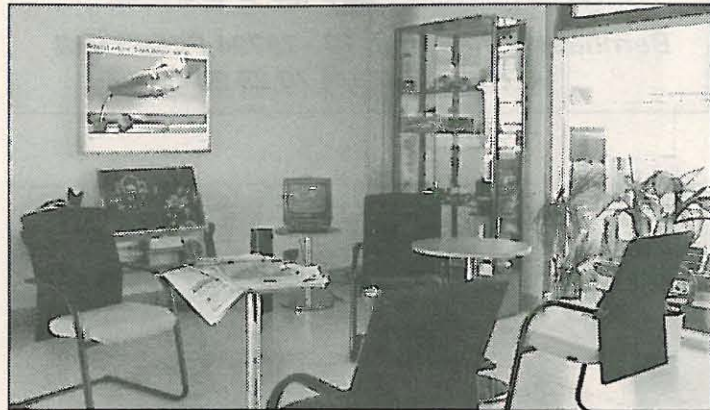
Die Kunden-Wartezone lädt zum Verweilen ein